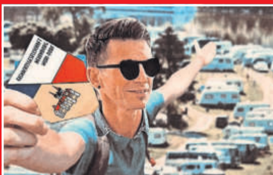
René der Geneigte