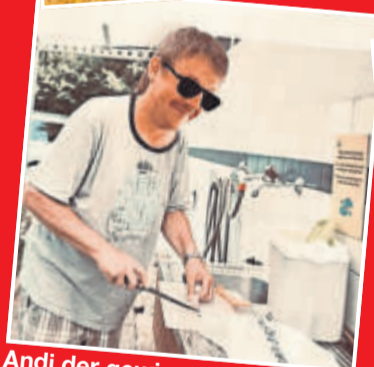
Andi der gewissenhafte Überflieger