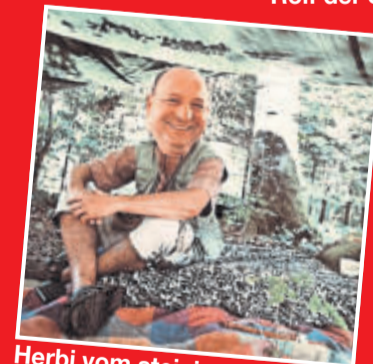
Herbi vom steinigen Rügen