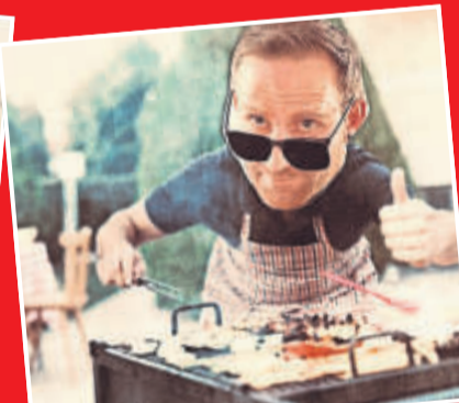
Luki der Drahtzieher vom Greuel